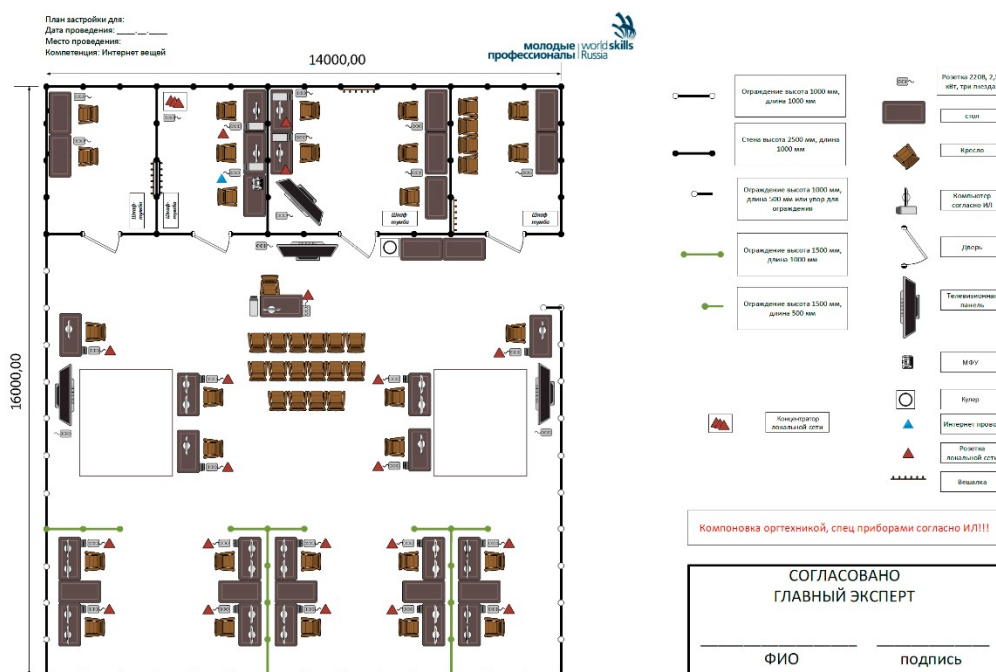
Рисунок 2. Схема конкурсной площадки

В комнатах экспертов необходимо установить запираемые шкафы для хранения ценных вещей участников и экспертов.