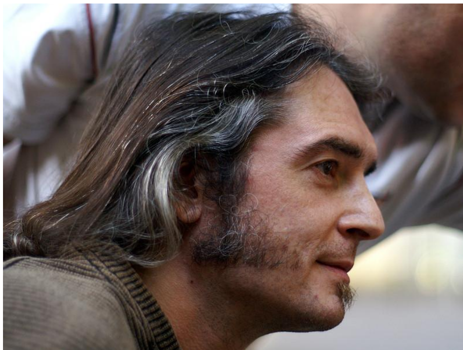
Рисунок А.1- «Очаговая седина»