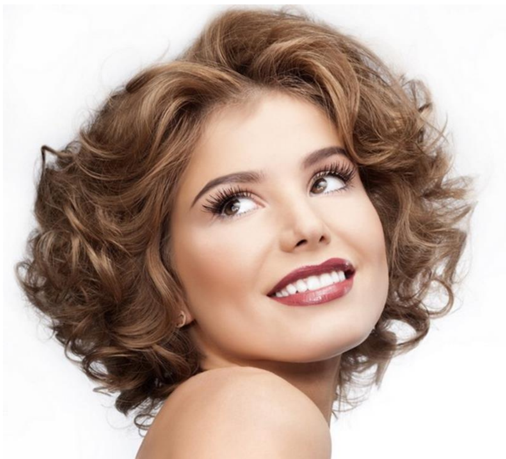
Рисунок Б.1 – «Укладка волос на бигуди»