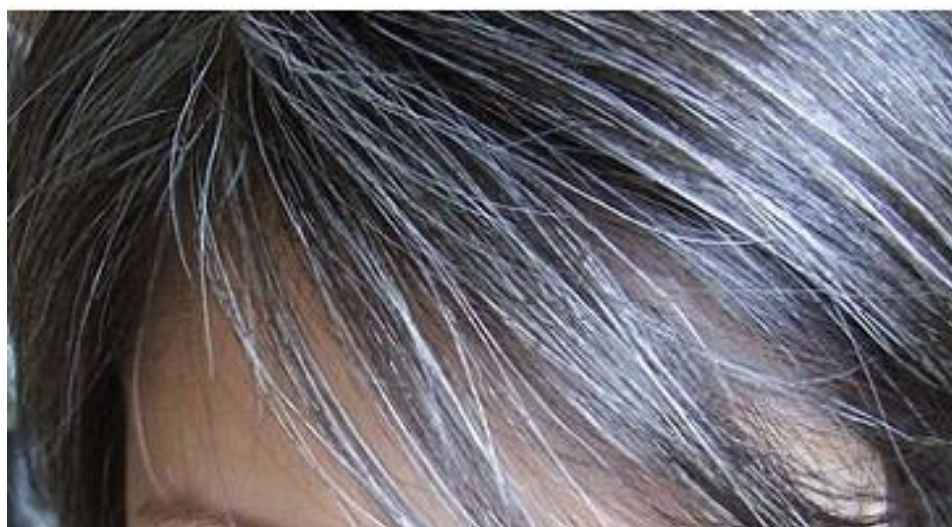
Рисунок А.2 – «Рассеянная седина»